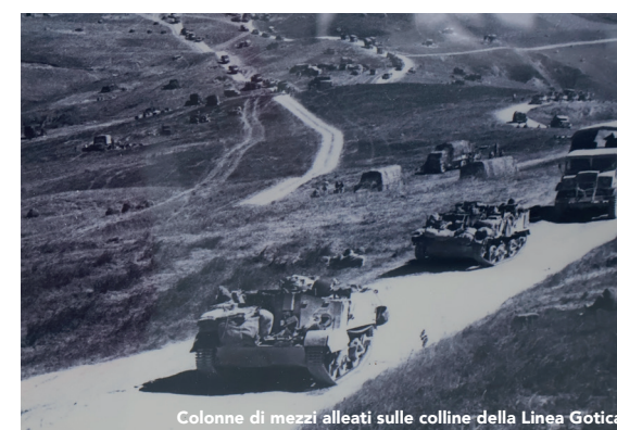
Colonne di mezzi alleati sulle colline della Linea Gotica